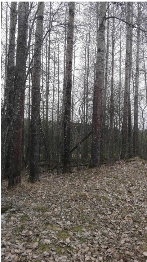
Kuva 1. Killon Naistenmatkantien haavikko (1.)

1. Pirkkalan pääväylän Naistenmatkantien vieressä oleva n. 100cm rinnan korkeudelta ympärysmitaltaan oleva ikääntyvä haavikko, jossa on myös luonnollista, lahoavaa kaatunutta haapaa (kuva 1) Metsiköstä ei löytynyt liito-oravan jätöksiä, mutta se on tukemassa liito-oravan tämän hetkistä esiintymää n. 300 metriä länteen Komperinmäkeen luonnollisia reittejä pitkin. Haapametsiköstä kaakkoon on nykyisen kaava-alueen sisällä harvapuustoista ja pensaikkoista, jotka on merkitty karttaan ok – tai (ok) merkinnöin. Ne merkinnät tarkoittavat, että niiden avulla liito-orava pystyy liikkumaan tai levittäytymään Komperinmäen ja Killon länsipuolella olevan luonnonsuojelun suuntaan (ks. kuva 2). Tähän alueeseen en suosittele kaavoituksen laajentamista uusilla tonteilla tai tonttien neliölää. Kaavoituksessa ei ole syytä poistaa näitä P-alueiksi merkittyjä kulkuväyliä kuin harkiten. Kohdissa missä on merkintä (ok) tonttia on mahdollista laajentaa kaavassa jos väylä haavikosta 1. liito-oravalle säilyy. Se on merkitty myös kaavoituskarttaan.