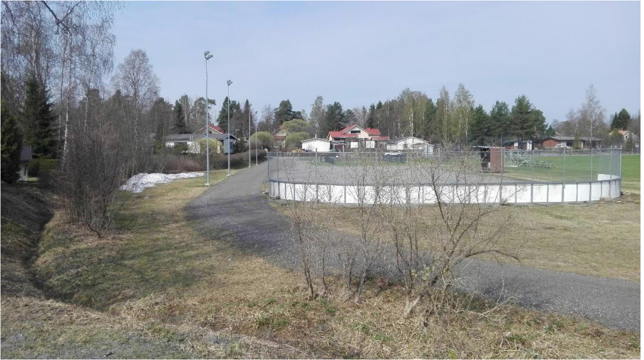
Kuva 6. Killon liikunta-alue huhtikuussa 2019.

6. Alueella lähinnä nuorta koivua ja pajuja. Riittäviä liito-oravan kulkureitiksi luonnonsuojelualueella ja Vadelmakorpeen. Tonttikaavoitusta ei kannata laajentaa tällä alueella.