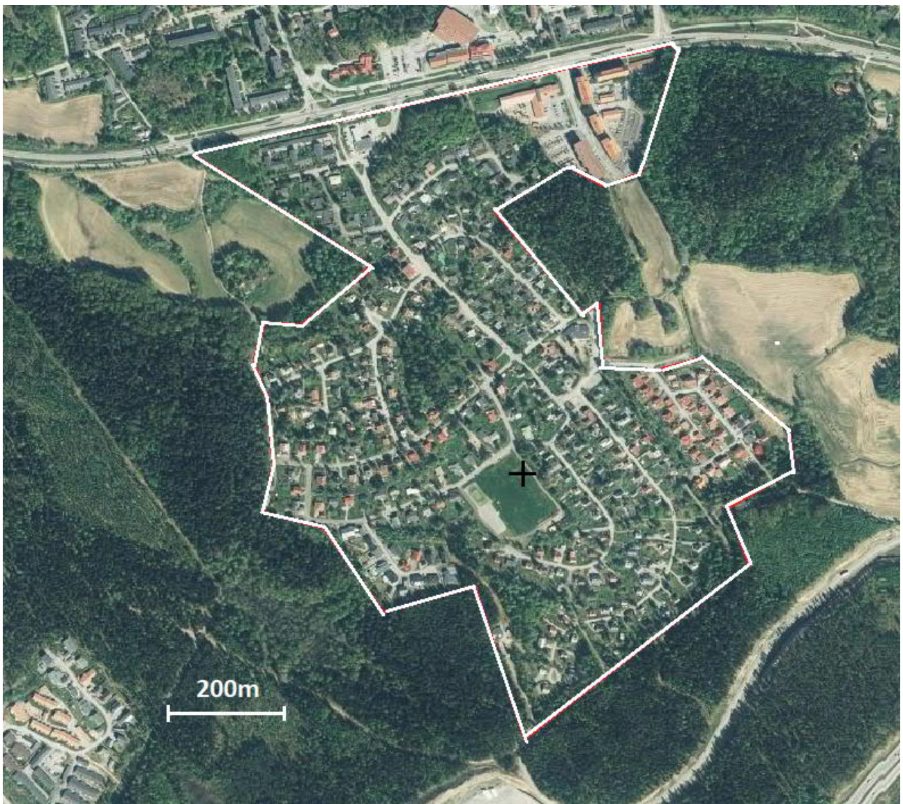
Kuva 9. Ilmakuva Killon nykyisestä asemakaavan rajoista. Jo pelkän ilmakuvan perusteella on hahmoteltavissa, että omakotiasutus ei ole esteenä liito-oravan levittäytymiselle ja paikoin jopa lajin lisääntymiselle asemakaavan alueella.

Liito-oravasta ei tehty havaintoja, mutta nykyisellään väylät ovat riittäviä lajin levittäytymisen mahdollistamiseksi ja jopa ydinalueiksi, missä kanta voisi lisääntyä (kuva 9.). Erityisesti kaavamerkinnän 2. alue on sopiva liito-oravan lisääntymiselle ja sitä tukisivat alueet 1. ja 3. Nykyiseltä esiintymisalueelta 400 metrin päässä sijaitsevalta Komperinmäeltä on tälle alueelle suora metsäyhteys. Yleisesti Killon asutusalue rajoittuu lännessä, etelässä ja osaksi idässä laajoihin tai laajahkoihin metsäalueisiin. Päivitetyssä asemakaavassa koko kaava-alueelle näille metsäalueiden kohdalla voidaan merkitä P, VL, EV tai vastaava merkintä. Tosin lännessä luonnonsuojelualue toimii jo tällaisena. Asemakaava-alueella olevien tonttien kokoa on mahdollista jonkin verran laajentaa tapauksissa, missä on hyvät perustelut ja muutos ei oleellisesti muuta kaavan ”hierarkiaa”. Pääasia on kuitenkin varmistaa, että Killon alueella varmistetaan liito-oravan liikkumismahdollisuus ja jopa lisääntyminen.