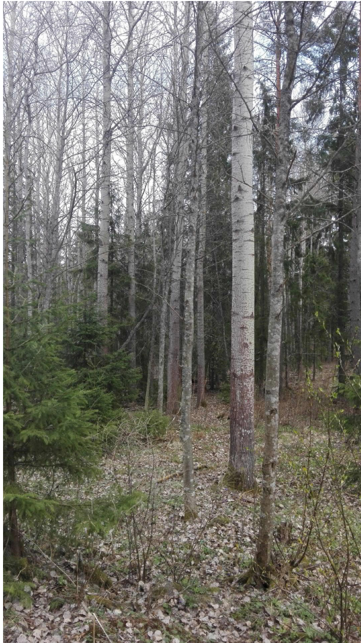
Kuva 3. Killon alueen 2. haavikkoa huhtikuussa 2019.

Komperinmäkeen (kuva 2.). Kaavoituskarttaan merkitty myös potentiaali tonttien lievään laajentamiseen jos on tarve.