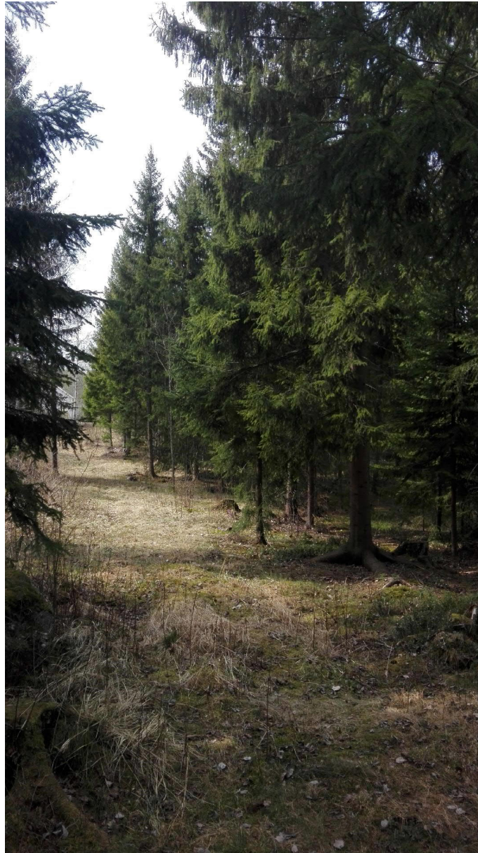
Kuva 8. Lähivirkistysaluetta kaava-alue 14.

14. Alueet merkitty vanhassa asemakaavassa lähivirkistysalueeksi, mikä sopii edelleen. Toimivat myös hyvin liito-oravan levittäytymisväylinä, mutta eivät kelpaa lajin ydinalueiksi (kuva 8.).